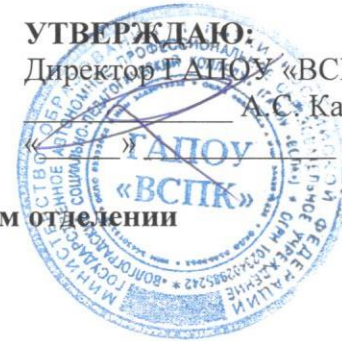
График сроков прохождения учебно-производственной практики на заочном отделении корпус по ул. Иркутская, д. 13 2024-2025 уч. год